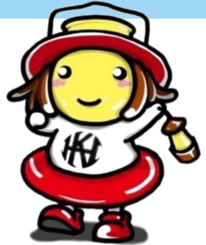
日本ヘレンケラー財団 公式マスコットキャラクター ランプちゃん