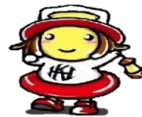
法人公式マスコット キャラクター ランプちゃん