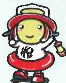
法人マスコットキャラクター ランプちゃん

最後に、法人本部が中心とな り各施設が、また職員ひとり一 人が同じベクトルを向きながら 目標に向かって邁進していただ きたい。