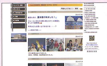
▲施設日記 (じょいふるはかた)