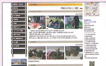
▲施設日記 (たんぼぼ園)