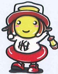
法人マスコットキャラクター ランプちゃん