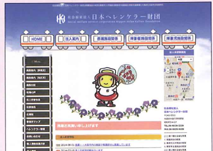
日本ヘレンケラー財団 HP トップページ▶